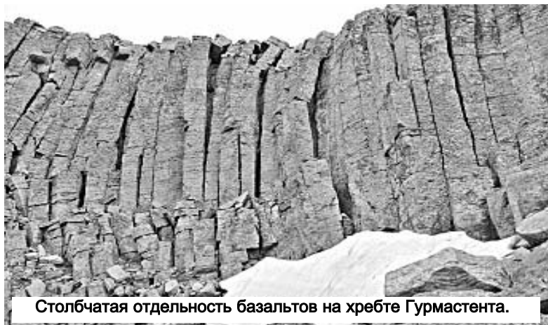
Столбчатая отдельность базальтов на хребте Гурмастента.

Скалы небезжизненны. Они заселены лишайниками, мхами, высшими растениями, которые поднимаются до самой верхней границы растительной жизни. Например, в массиве Конгур в Китае (Памир и Западный Куньлунь) преобладают обнаженные