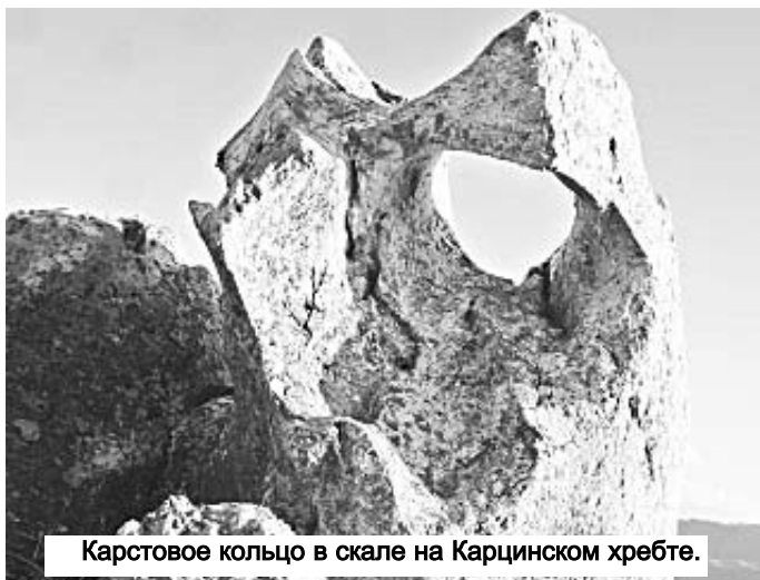
Карстовое кольцо в скале на Карцинском хребте.