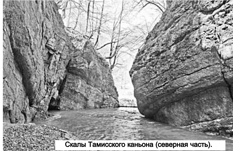
Скалы Тамисского каньона (северная часть).