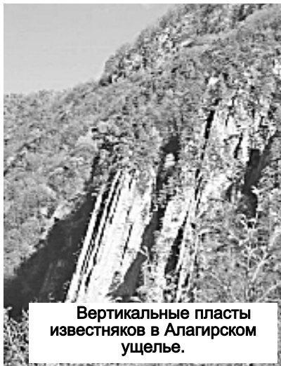
Вертикальные пласты известняков в Алагирском ущелье.