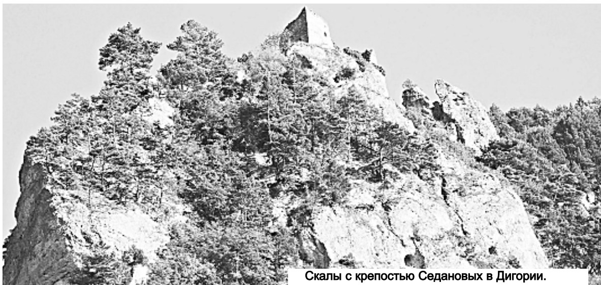
Скалы с крепостью Седановых в Дигории.